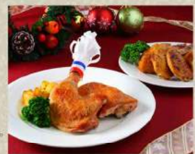
クリスマスチキン 2,500円