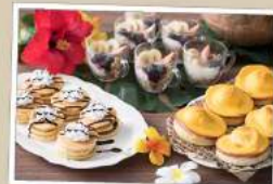
「エッグベネディクト」や「アサイーボウル」

夏の朝食は今年もグレードアップ! テーマは「世界の朝ごはん」 日本定番の朝食に加え世界10カ国の朝食を お楽しみになれます。