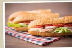
スペイン風サンドウィッチ「ボカディージョ」

料金 13才以上 3,000円 7才～12才 2,000円 / 4才～6才 1,200円 3才以下 無料