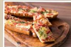
ポーランド風ビザトースト「ザビエカンカ」