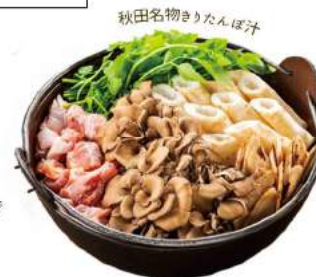
秋田名物きりたんぼ汁

コメの国にふさわしい秋田を代表する郷土料理。鈴和商店創業以来続く手巻き・炭火焼きの手法で焼き上げるきりたんぼは県内唯一。米にはササニシキを使用し、職人が一本一本焼き上げた伝統の味。