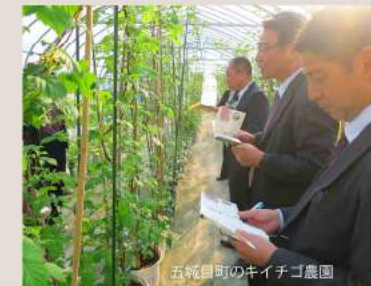
五城目町のキイチゴ農園

五城目キイチゴ&田沢湖エコニコ農園ブルーベリー 国内産キイチゴの先駆け、五城目町のキイチゴ。山々に囲まれた冷涼な気候はキイチゴ栽培の好適地。甘みと酸味のほどよいバランスが特長。農業を使わず土づくりにこだわったブルーベリー。甘くて大粒、濃厚な風味が口いっぱいに広がります。