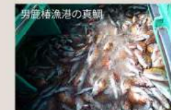
男鹿橋流港の真鯛