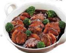
秋田牛ビーフシチュー