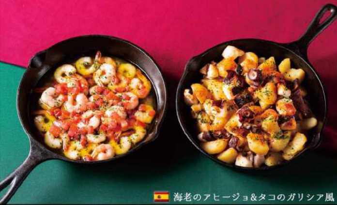
🇪🇸 海老のアヒージョ&タコのガリシア風

噛むとあふれ出るジューシーで濃厚な水牛ミルクの味わいが格別な「イタリア産水牛のモッツアレラ」や魚介類を多く用いて鍋についたオコゲまで楽しめるところが日本人にも親しみやすい「パエリア」など魚介や野菜をふんだんに使用した色鮮やかでヘルシーな両国代表料理が勢ぞろい。