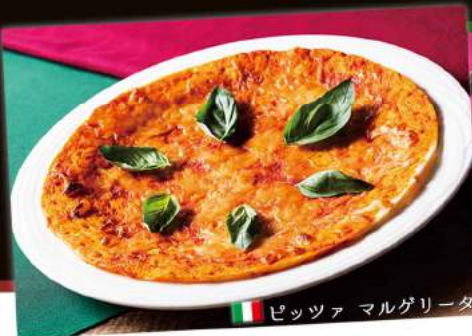
🇮🇹 ピッツァ マルグリータ