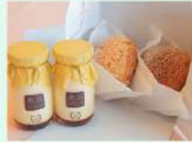
舞浜プリンと舞浜はちみつシュークリームセット

松阪牛ステーキ弁当 2,400円 / ブラックアングスステーキ弁当 1,800円 / 舞浜特製牛ヒレカツ弁当 1,780円 うなぎ蒲焼き重 1,680円 / オマール海老カレー 1,800円 / 冷製オードブル6種盛り合わせ 3,000円 ほか