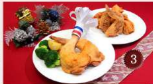
宮崎県の銘産鶏「日南どり」を使用した『クリスマスチキン』