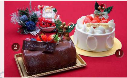
こだわりのスポンジに甘き搾乳の生クリームをたっぷり使用した『スノークリスマス』と2層のチョコレートムースの『ブッシュ・ド・ノエル ショコラ』

ご予約期間 受付中～12月18日 10:00～22:30 お渡し場所・日時 レストランファインテラス 12月19日～12月25日 10:00～22:30 お届け地域 浦安市全域、市川市南行徳地区内、江戸川区新川以南地区(葛西エリア)内 お届け日時 12月19日～12月25日 14:00～18:00