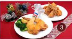
宮崎県の銘産鶏「日向どり」を使用した「クリスマスチキン」