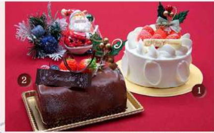
こだわりのスポンジに甘さ控えめの生クリームをたっぷり使用した「スノークリスマス」と2層のチョコレートムースの「プッシュ・ド・ノエル ショコラ」